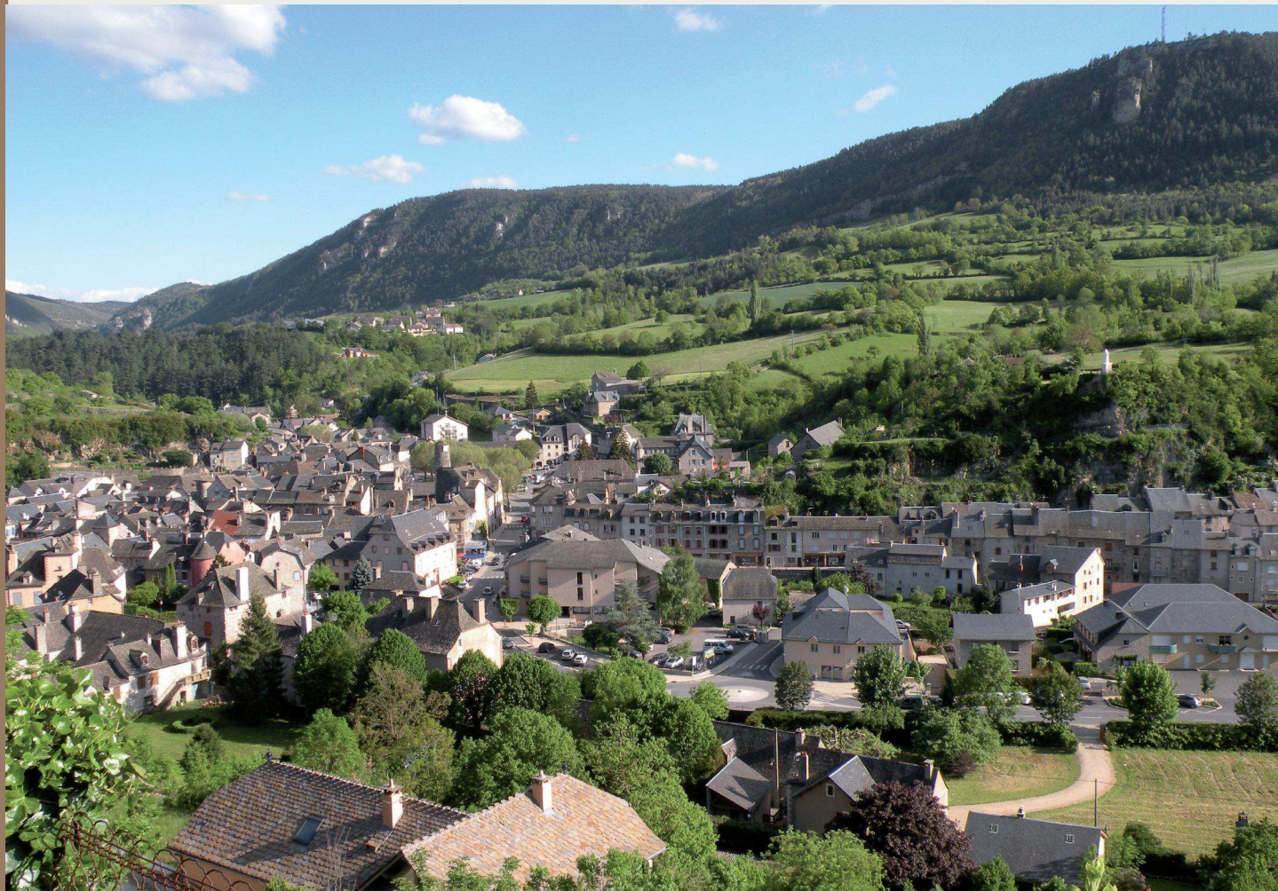
La Canourgue, vue générale

La Canourgue, le village d'accueil , dispose d'une situation géographique privilégiée. Elle fait partie de la région des Grands Causses puisqu'elle est bâtie au pied du Causse de Sauveterre, mais elle est toute proche de l'Aubrac et des Gorges du Tarn, située dans le département de la Lozère, aux confins du département de l'Aveyron. Elle est donc en périphérie du Parc des Grands Causses.